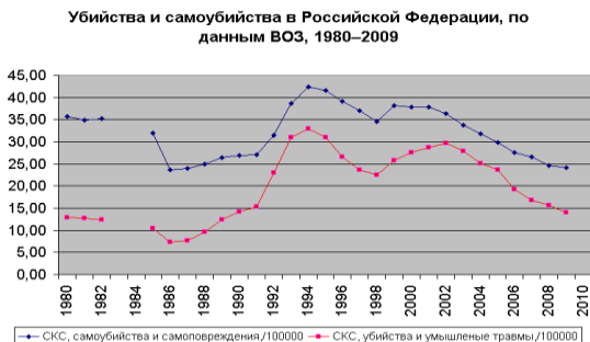
Рисунок 1 – Статистика по убийствам, умышленным травмам, самоубийствам и самоповреждениям в России [2].

связано с конфликтами, стихийными бедствиями, пережитым насилием, чувством изоляции. Уровень суицидов высок среди заключенных, жертв половых преступлений, различных дискриминируемых групп (меньшинств). Одновременно меньшинства имеют высокий риск стать жертвами «преступлений ненависти» ( hate crime ) – в том числе и умышленных убийств.