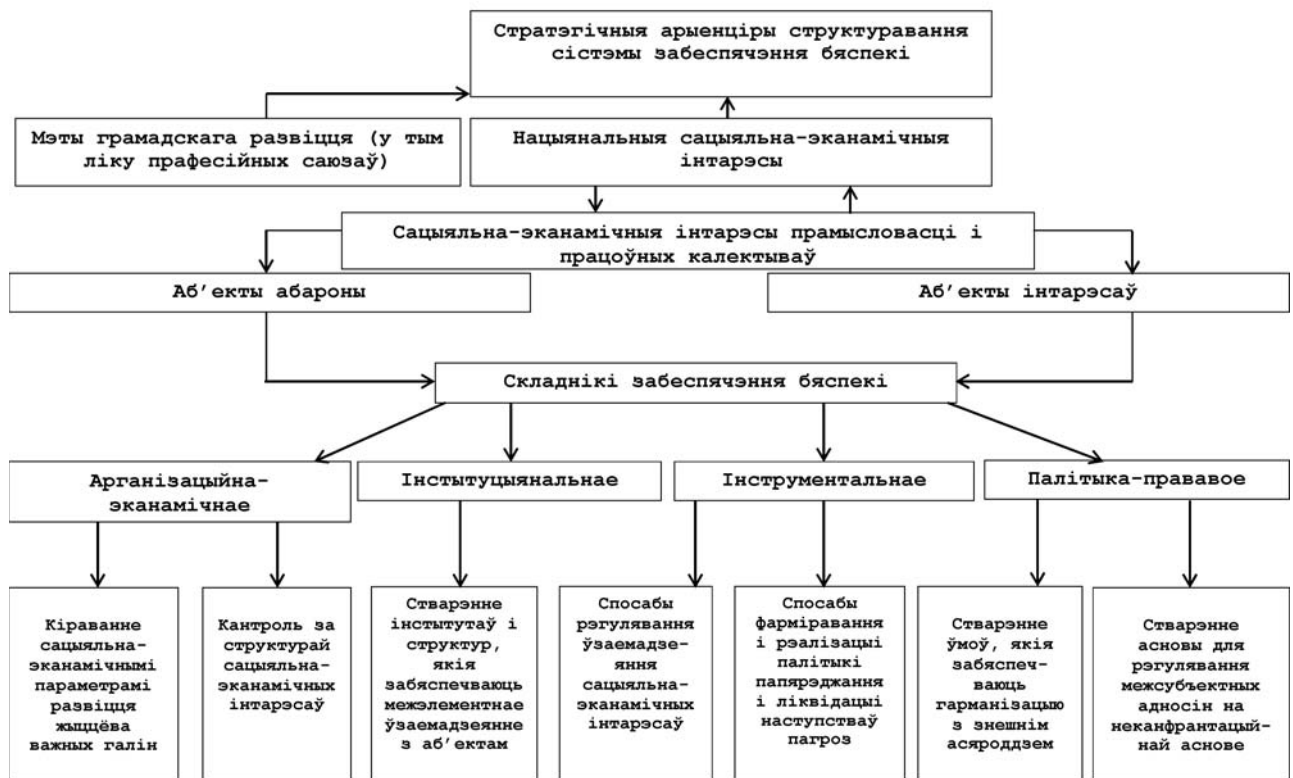
Малюнак 2 – Структурна-лагічная схема фарміравання сістэмы забеспячэння сацыяльна-эканамічнай бяспекі прамысловага сектара з ўдзелам прафсаюзаў

бару методык забеспячэння дзяржаўнай бяспекі і яе разнастайных разнавіднасцяў. Праведзены намі аналіз палажэнняў палітычных дакументаў шэрагу дзяржаў, якія вызначаюць базу іх сацыяльна-эканамічнай бяспекі, паказаў, што яны нацэлены па масіву прыярытэтных фінансава-эканамічных інтарэсаў [8–13].