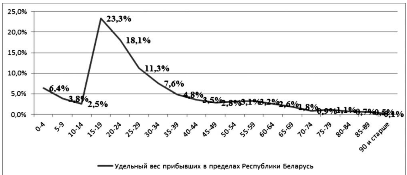
Рисунок 2 – Миграция населения Республики Беларусь по возрастным группам в 2015 г.